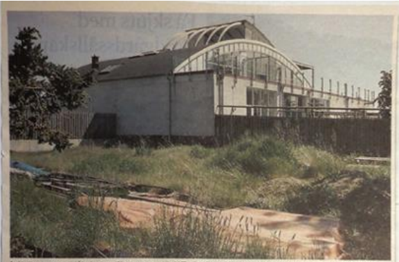
Irritationsmoment - ämningarna för grannarna - vid Tunbyvägen i Torekov, ett för högt hus och en medskräpad tomt.